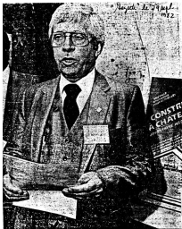
Mayor Philippe Borneau wants to trigger construction in South Shore suburb: