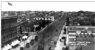
Artère principale de la ville de Moose Jaw SK vers 1918 / Main Street of Moose Jaw, SK, about 1918.

The British Cemetery contains the graves of 145 soldiers from the United Kingdom (largely 2 nd Suffolks and 13 th King's Liverpools) and six from Canada; seven of these graves are unnamed. It covers (without the access path) an area of 451 square yards. It is enclosed by a brick wall, and planted with white thorn trees. It stands on the hillside, in arable land, facing another hillside across the road.