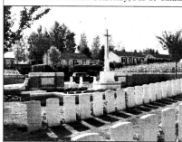
Ecoust-St Mein British Cemetery, Pas-de-Calais

Informations transmises oralement ; Le Registre des cimetières, Ottawa, Canada ; Internet (2004).