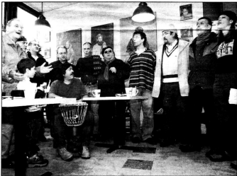
LES MEMBRES de la chorale de l'Accueil Bonneau et ceux qui pilotent le projet du film Recyclage ont offert un petit tour de chant. Ici, au Café sur la rue du journal L'Éclair.

«J'ai envoyé des documents à Vivadiz, à Atlantis... J'espère qu'on va trouver un distributeur. Ce film, c'est une autre forme de réinsertion sociale.»