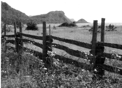
Fleurs des champs dans une prairie fleurie devant les montagnes du Bic.