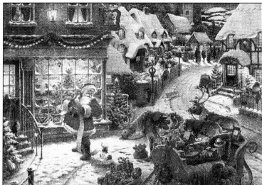
Liste de Noël auteur inconnu Source publicité de Noël.

Poste Canada Numéro de la convention 41762515 de la Poste-publication Retourner les blocs adresse suivantes: Association famille Bonneau 800 boul. marcotte Roberval (Qc) G8H 2A3